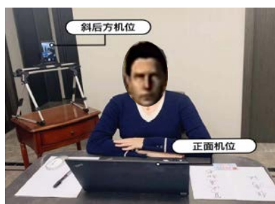
图 1 考生双机位示意图

5) 考生需将腾讯会议用户的头像更改为本人近期免冠头部照片。面试采用双机位，环境机位要求能在侧后方监控考生和主机位屏幕。应急通信手机应出现在环境机位图像中并远离考生本人。