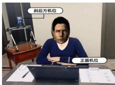
图 1 考生双机位示意图

5) 考生需将腾讯会议用户的头像更改为本人近期免冠头部照片。面试采用双机位，环境机位要求能在侧后方监控考生和主机位屏幕。应急通信手机应出现在环境机位图像中并远离考生本人。